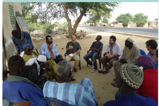
Réunion avec l'ASUREP de Diagambal