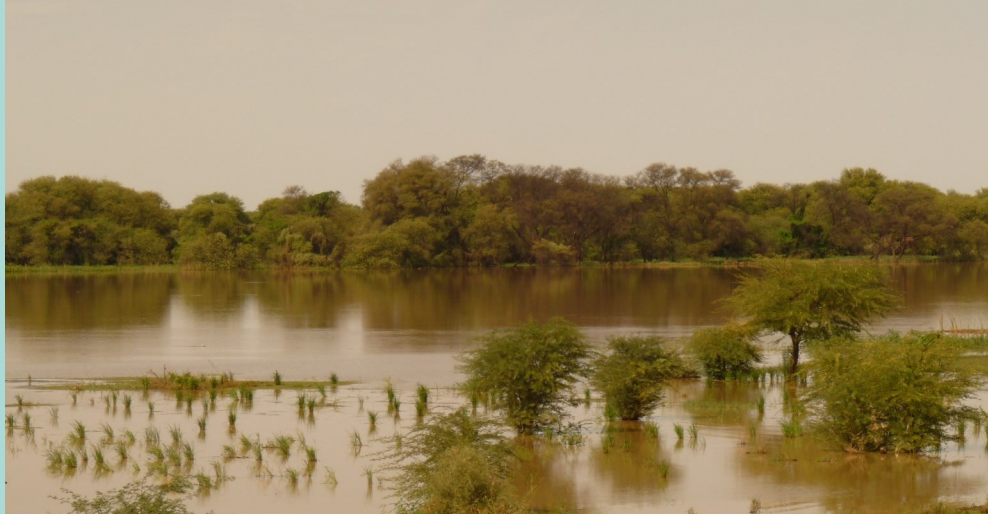
Le fleuve Sénégal, principale source d'eau des populations de la zone Nord