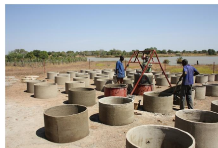
Carte de l'accès à l'eau potable de la région (Atlas 2015)

Ce projet va constituer la première expérience au Sénégal sur cette nouvelle approche que le Gret a déjà testé et capitalisé au Madagascar, au Burkina Faso et en Mauritanie.