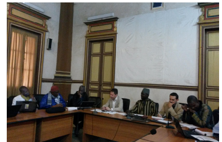
Réunion de l'UGP Aicha élargie