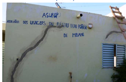
Local technique de la station de Mbane