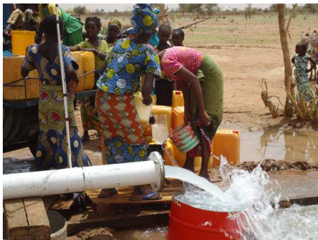
Pompage d'essai à Weyndou Diami

Longtemps confrontées au casse-tête que constituait l'approvisionnement en eau potable, les populations de Weyndou Diami ont manifesté leur joie au rythme des tam-tam lorsqu'elles ont vu couler l'eau pour la première fois à un débit de 25m 3 /h. L'attribution des marchés de travaux relatifs au réseau d'AEP (château d'eau de 100m 3 , pompe immergée, groupe électrogène et 8,6 km de réseau d'eau) est en cours.