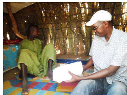
Enquêtes socio-économiques à Bokhol