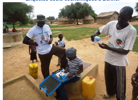
Mesure de chlore résiduel à la BF de Keur Birane (Bokhol)