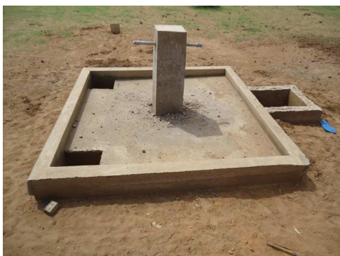
Borne fontaine construite à Weyndou Samba

La réception provisoire des travaux est prévue dans la première quinzaine du mois d'octobre 2013.