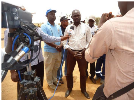
Point presse lors de la réception du forage