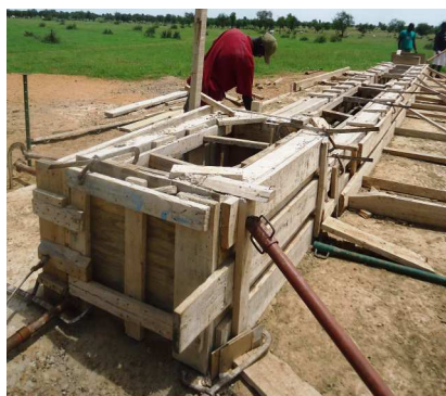
Abreuvoir en cours de réalisation à Weyndou Samba