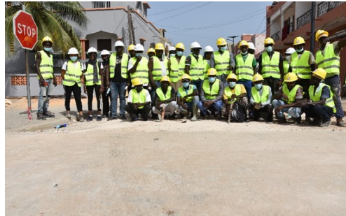
Ecole chantier à Sentenac, commune de Wakhinane