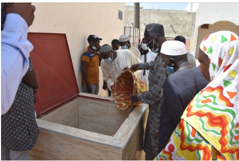
Réception de puisard à Sentenac, Wakhinane

En ce qui concerne les ouvrages collectifs, un chantier a été financé et réalisé à ce jour, pour un montant total de 1 001 370 f CFA (1 500 euros) représentant le 1/4 du financement de l'ouvrage. Les remboursements viennent de débiter récemment et s'élèvent à 110 000 f CFA (168 euros). Le fonds de rénovation urbaine, hébergé sur un compte dédié, a été doté de 30 000 euros au 31 décembre 2020. Les études sont en cours d'achèvement pour deux autres chantiers communautaires.