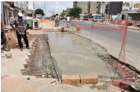
Coulage d'arrêtoir d'eau à Sentenac, Wakhinane