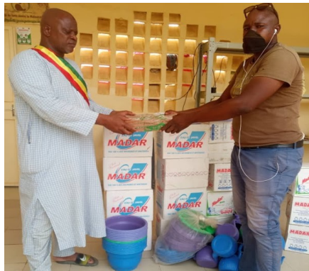
Distribution de kits d'hygiène et de dispositifs de lavage des mains dans une école de Ballou