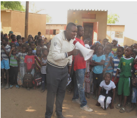
Sensibilisation en milieu scolaire

Aussi, en complément des campagnes de promotion de l'hygiène et de l'assainissement domestique, des toilettes publiques (« édicules ») ont été construites par les artisans formés par le projet ASAP dans des gares et marchés et surtout dans les centres de santé ou établissements scolaires qui n'étaient pas équipés, ou dont les infrastructures étaient très saturées et dégradées. Tous ces établissements ont été dotés de kits d'hygiène (savon, eau de javel) et de dispositifs de lavage des mains. Les collectivités locales ont cofinancé les investissements dans les infrastructures.