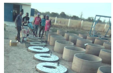
Latrines préfabriquées par un opérateur Souroura

D'autres ventes étaient encore en cours pour le mois de décembre : les carnets de commandes des opérateurs sont pleins. Le défi est désormais de réduire les temps de construction et de pérenniser cette dynamique de ventes en phase post-projet.