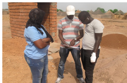
Formation à la construction de latrines