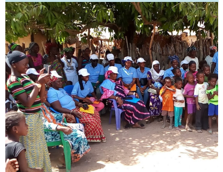
Sensibilisation dans un village de Dialacoto

La réalisation de ce film documentaire devra permettre de capitaliser sur l'approche du projet, le niveau d'implication et d'appropriation du projet par les collectivités locales et les services techniques déconcentrés, recueillir des témoignages des bénéficiaires et acteurs clés: leaders d'opinion (chef de village), opérateurs, de sanimarchés et relais commerciaux, collectivités, services déconcentrés de l'Etat, etc.