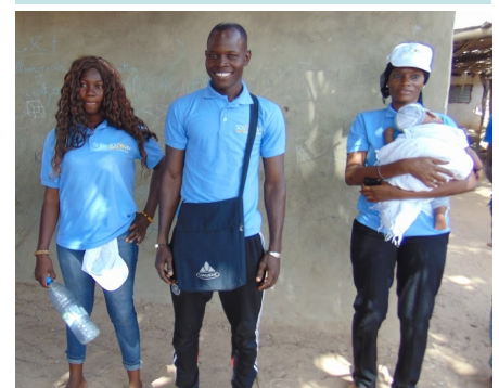
Animateurs du projet ASAP

Aussi, après une phase de sensibilisation à la gestion de l'hygiène menstruelle auprès de différents publics (y compris des hommes), le GRET appuie le groupement des femmes de la commune de Bani Israël dans la production et la vente de serviettes hygiéniques lavables.