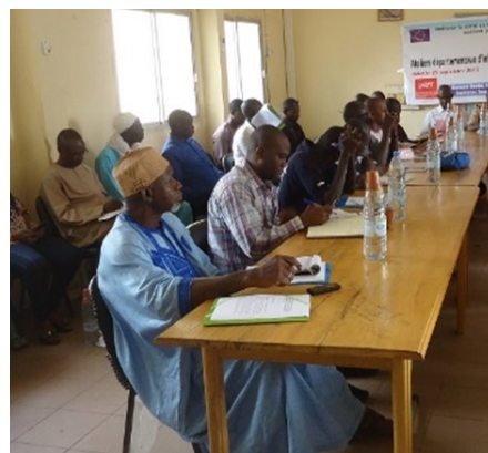
Atelier départemental de formation et information des communes

Une délégation de Tambacounda (ARD, SRA) s'est rendue à Saint-Louis au mois d'août, avec l'équipe du projet ASAP, pour un échange de pratiques. Les débats ont notamment porté sur la planification régionale, départementale et municipale des services d'eau et d'assainissement, l'animation des cadres de concertation régionaux ou encore le suivi technique et financier des services d'eau et d'assainissement.