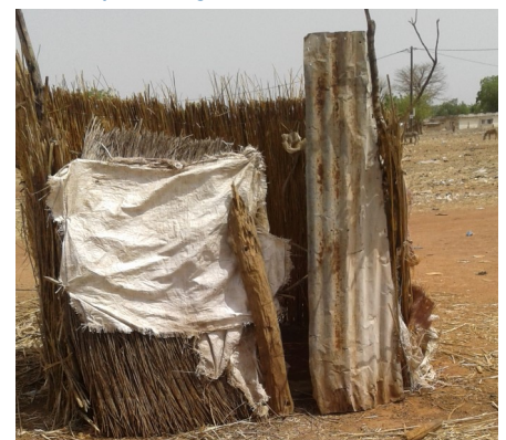
Latrine traditionnelle construite par un ménage