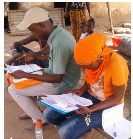
Enquête ménage lors de l'étude de marché