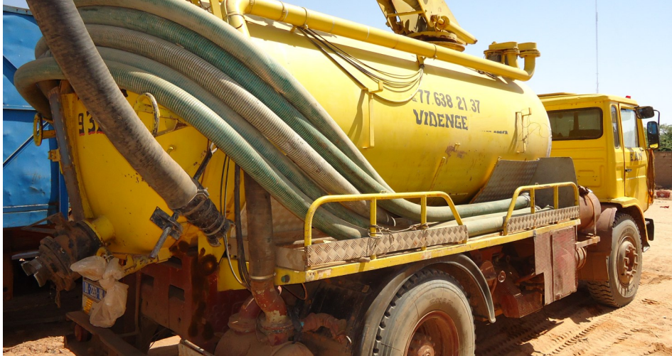
Camion de vidange à Ross Béthio