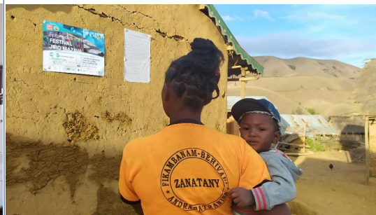
Extrait des visuels de l'évènement à Antsamaka