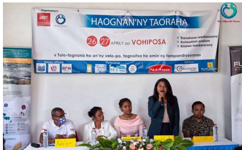
Conférence de presse de lancement