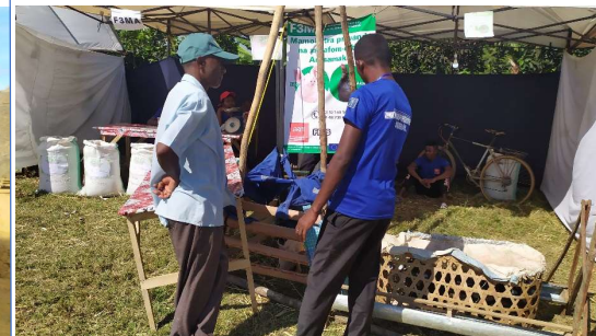
Participation des entrepreneurs ruraux formés