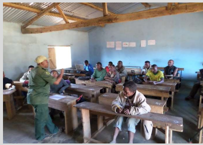
Formation des membres du KMDT à Ampandrana