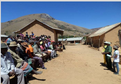
Réunion de sensibilisation à Beanatsindra