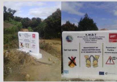
Murettes de sensibilisation installées à l'entrée du Bassin Versant